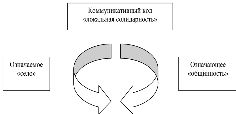
Рис. 3. Процессы формирования коллективной идентичности «сельские жители» 1993–...

например, государственной социальной поддержки*. При воспоминании об этом времени большинство информантов прибегает к негативным коннотациям, которые мы относим к дискурсу «катастрофы»: «Нас бросили! Мы никому не нужны!»**. Мозаика современной сельской жизни в условиях идеологического вакуума складывается из нескольких источников: 1) из советского дискурса «коллектив», 2) из растиражированного (в том числе и в советское время) с политическими целями научного дискурса «община», 3) из практик выживания. И в этой мозаике рождается интердискурс об «общинности». Он и наполнил «пустой» концепт «сельские жители» (рис. 3).