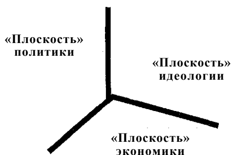
Рис. 1. Феномен общества в системе теоретических координат

Видимо, до тех пор пока не предложено конвенциональной, то есть принятой и разделяемой большинством, социологической методологии, которая позволяла бы анализировать эти подсистемы совместно, в рамках определенного типа общества, названное противоречие останется. Попробуем включить «социологическое воображение» с тем, чтобы сделать первый шаг к преодолению этого противоречия, попытаемся предложить такое рассуждение, в котором фиксируется одновременно и единство, и триединство общества. Схематически оно представлено на рис. 1.