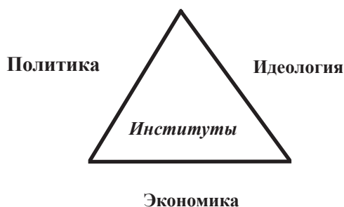
Рис. 2. Схематическое представление институциональной матрицы

Устойчивая, исторически складывающаяся система базовых институтов, регулирующих взаимосвязанное функционирование основных общественных подсистем — экономической, политической и идеологической, — представляет собой институциональную матрицу. Образующие ее базовые институты формируют своеобразную внутреннюю арматуру, жесткую структуру, обеспечивающую функционирование общества как целостного образования. Схематически институциональная матрица пред-