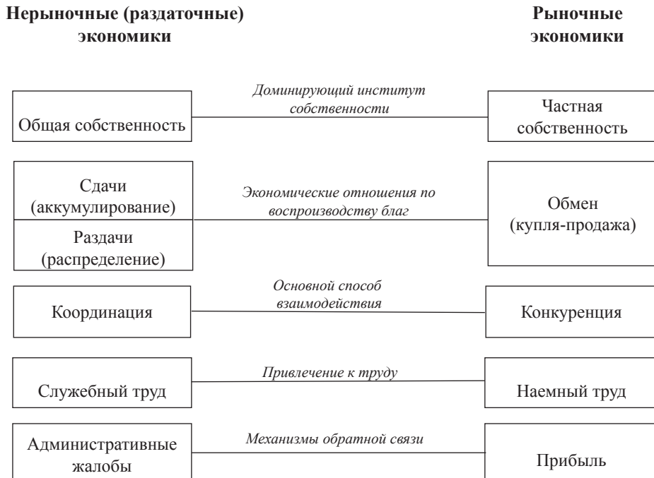
Схема 1. Базовые институты в нерыночных (раздаточных) и рыночных экономиках