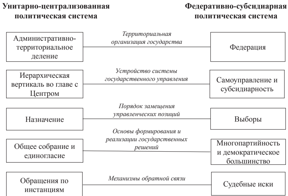
Схема 2. Базовые институты в унитарно-централизованной и федеративно-субсидиарной политических системах.