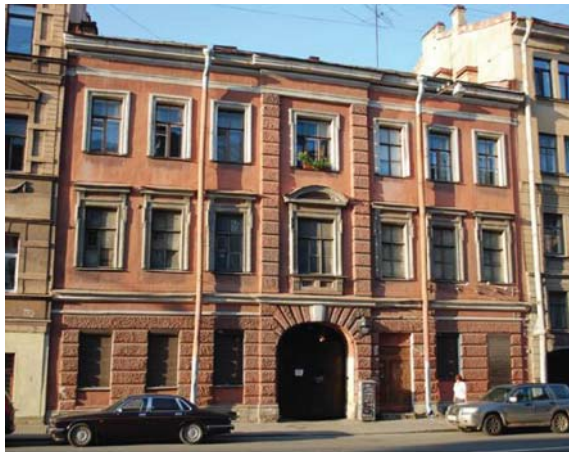
Рис. 1. Дом Юргенса. Улица Жуковского, дом 19.

альные условия, в контексте которых происходит оспаривание городского пространства, мы рассмотрим на эмпирических материалах двух изученных нами случаев. Данными случаями будут выступать протестные инициативы локальных сообществ и их лоббистов против потенциального сноса дома Юргенса в Санкт-Петербурге (ул. Жуковского, д. 19, центр города, рис. 1) и борьба за сохранение архитектурного комплекса Порт-Маон: старинного здания молочной фермы Монтсури и прилегающей к ней усадьбы Сен-Жак в Париже (улица Томб-д'Иссуар, 14 округ, периферия Латинского квартала, рис. 2).