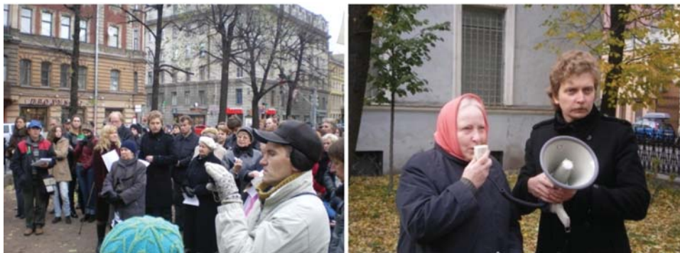
Рис. 6. Митинг в защиту дома Юргенса 16 октября 2010 г.

инстанции, начиная с Матвиенко и кончая более низкими инстанциями. Вы знаете, кроме отписки нам никто ничего, кроме... Вот, частный владелец квартир в этом доме имеет право делать все, что он хочет. Значит, в результате мы оказались в бесправовом пространстве» (Интервью 4. Жительница дома № 17 по ул. Жуковского). Данная ситуация заставила членов локального сообщества приступить к активным продолжительным публичным акциям протеста, как непосредственно у дома Юргенса, так и на митинге в защиту особняка, который состоялся 16 октября 2010 г. неподалеку от ул. Жуковского в сквере Маяковского (рис. 6).