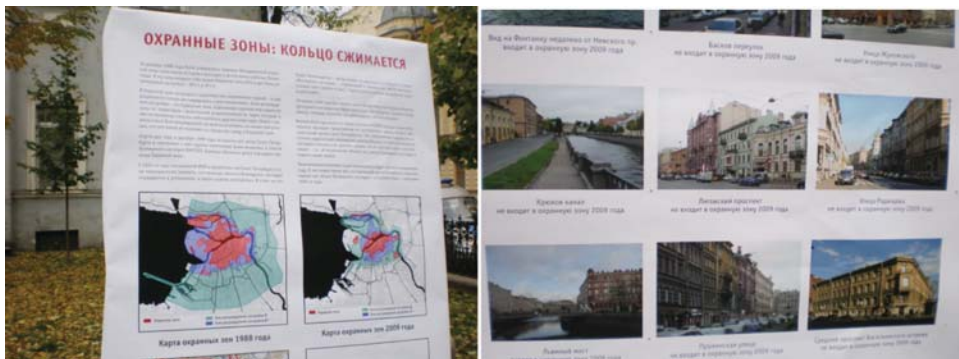
Рис. 7. Плакаты на митинге в защиту дома Юргенса

В сравнении со случаем оспаривания городского пространства на Томб-д'Иссуар, коалиции защитников дома Юргенса помещают свой случай в контекст иных градостроительных угроз в городе. Так, например, организация «Живой город» в ходе митинга демонстрировала плакаты с информацией об улицах, которые были исключены из охранных зон и поэтому находятся в ситуации риска сноса (рис. 7).