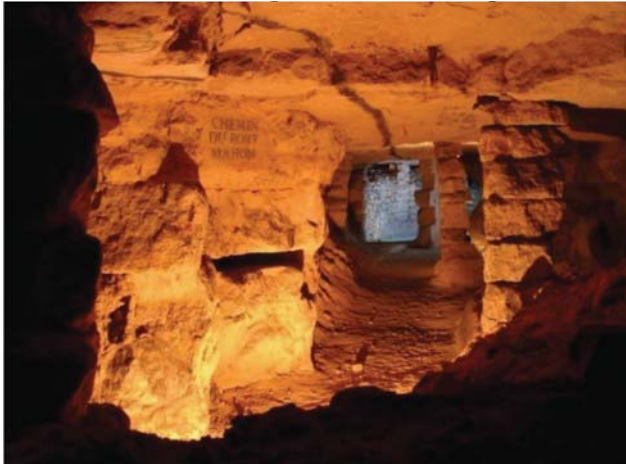
Рис. 4. Карьер дороги Порт-Маон

Дом Юргенса хотя не является памятником архитектуры федерального значения, ценен как образец строительства XIX в. и находится в центре города, т. е. на территории, где, за исключением редких случаев, связанных с необратимой аварийностью, снос зданий запрещен. Территория, на которой расположен архитектурный комплекс фермы Монтсури и усадьбы Сен-Жак, имеет археологическое значение для медиевистов, поскольку представляет собой неразработанный участок, имеющий богатый культурный слой, свидетельствующий о технологиях строительства в Средние века (рис. 4).