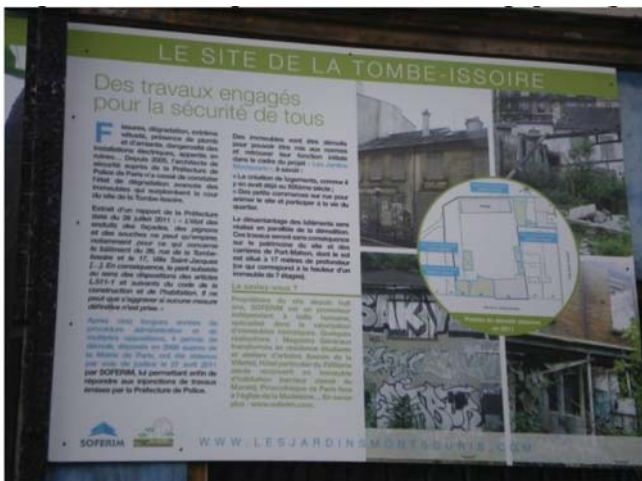
Рис. 5. Плакат «Soferim» на Томб-д'Иссуар: «Работы проводятся с целью сохранения»

Однако Региональная дирекция по делам культуры выдает «Soferim» разрешение на проведение дальнейших работ в карьере. При этом инвестором публично декларировалась сохранность исторических объектов фермы (рис. 5).