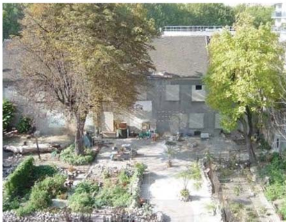
Рис. 2. Сад во дворе фермы Монтсури