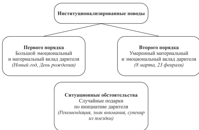
Рис. 2. Эмпирическая классификация поводов дарения книг

Последней группой поводов дарения, не описанной в литературе, но использованной в качестве теоретической опоры исследования, выступили ситуационные обстоятельства . В отличие от предыдущих групп, они не имеют конвенциональной привязки, в связи с чем информанты не ориентировались на контекст самого повода ввиду его недостаточности. В качестве опоры при выборе книги использовались интересы или хобби получателя, совместные интересы дарителя с получателем. Также в случае ситуационных поводов инициатива дарения исходит преимущественно от дарителя, в то время как получатель не имеет ожиданий относительно дара. Данная социальная ситуация может соотноситься с феноменом «статусной тревоги» (status anxiety) (Schwartz 1967) ввиду того, что даритель обладает властью над ситуацией. В данном случае даритель не опирается на контекст повода, в связи с чем может проявляться страх показаться «неискренним» и поверхностным, если подарок не соответствует интересам получателя, что соотносится с идеями Барри Шварца (Schwartz 1967). Получатель же не может оценить степень соответствия дара ситуации ввиду неконвенциональности повода и может остаться в нересiproчных отношениях с дарителем.